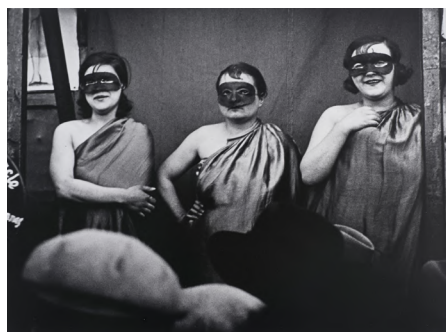
Brassai Les trois femmes masquées pour la Parade, Paris, France, 1931.